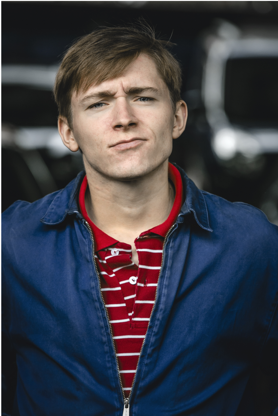
Cornelius Kiene - Foto 8