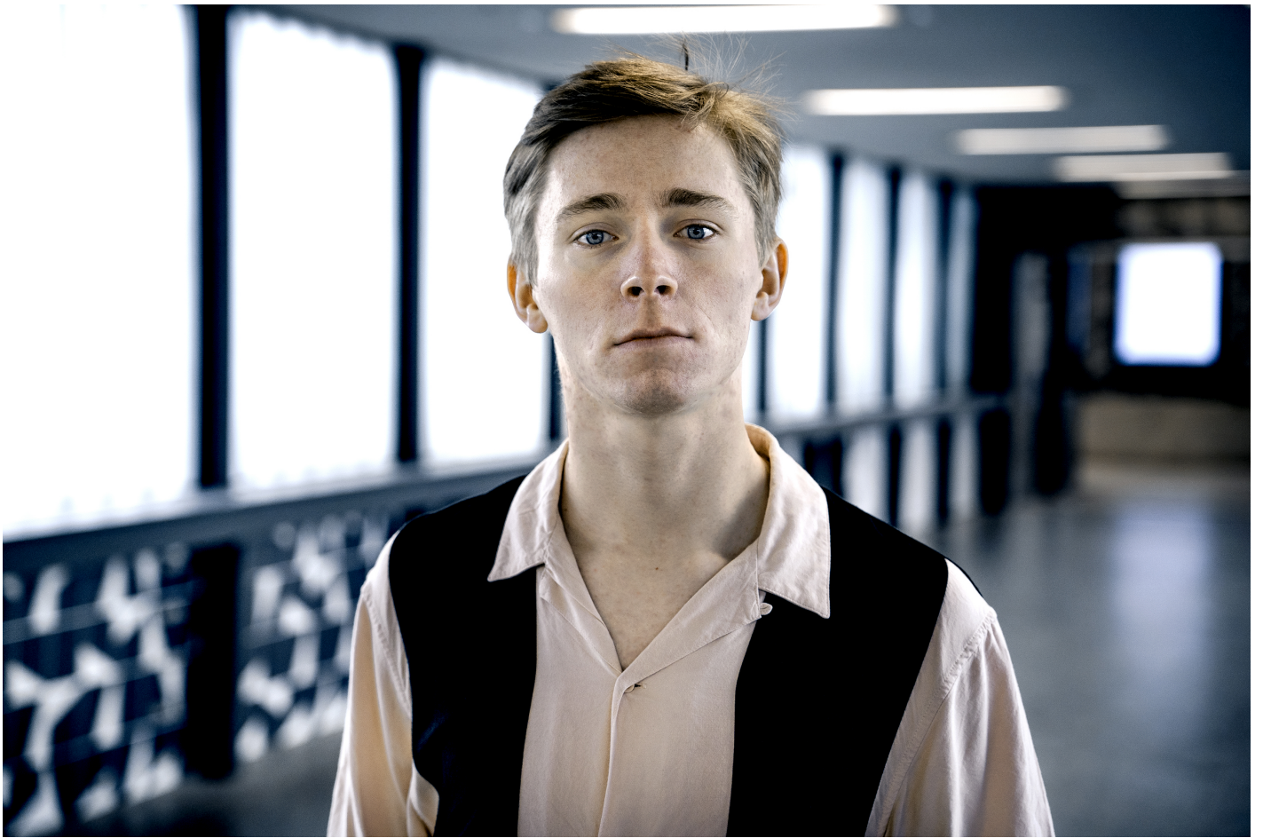
Cornelius Kiene - Foto 2 © Christian Hartmann