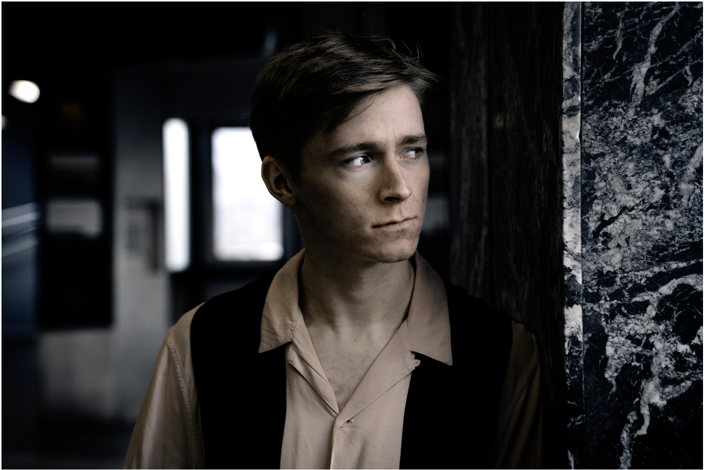
Cornelius Kiene - Foto 10 © Christian Hartmann