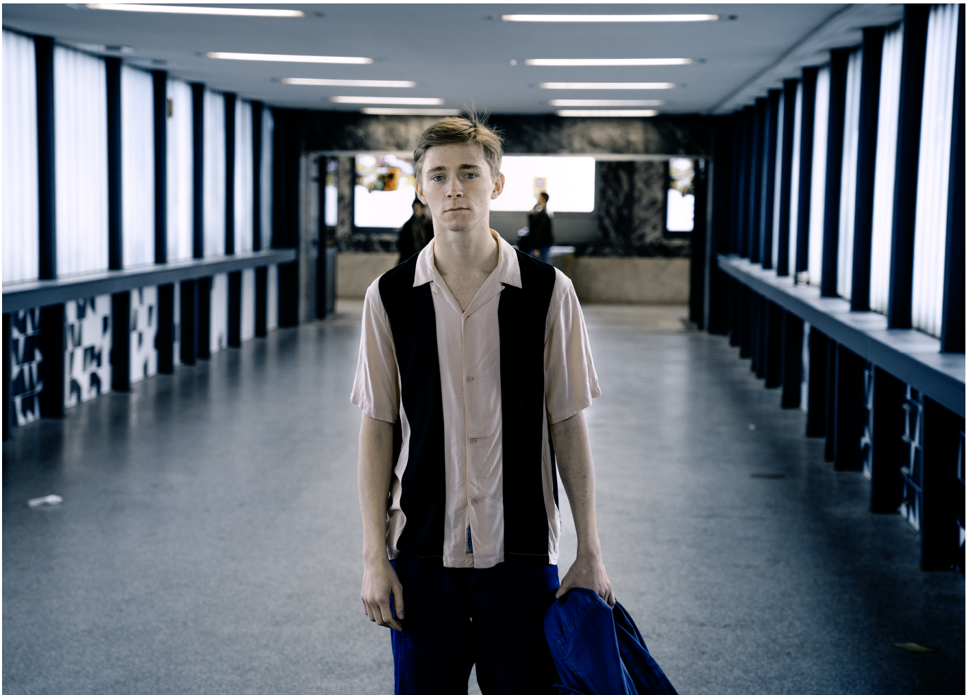
Cornelius Kiene - Foto 4