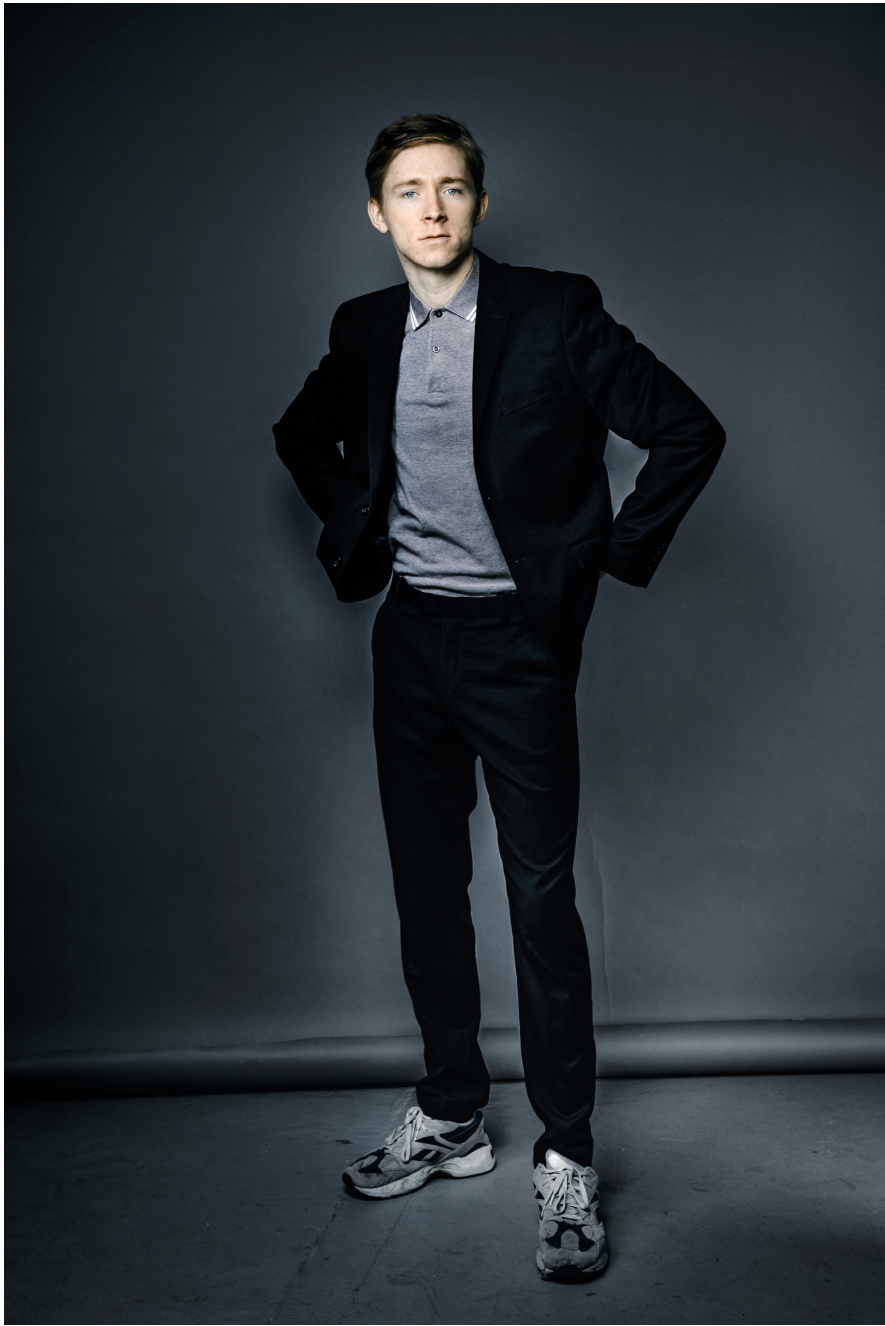
Cornelius Kiene - Foto 6 © Christian Hartmann