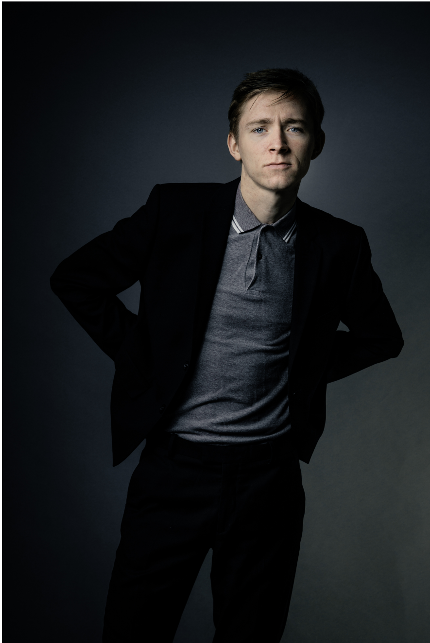
Cornelius Kiene - Foto 5