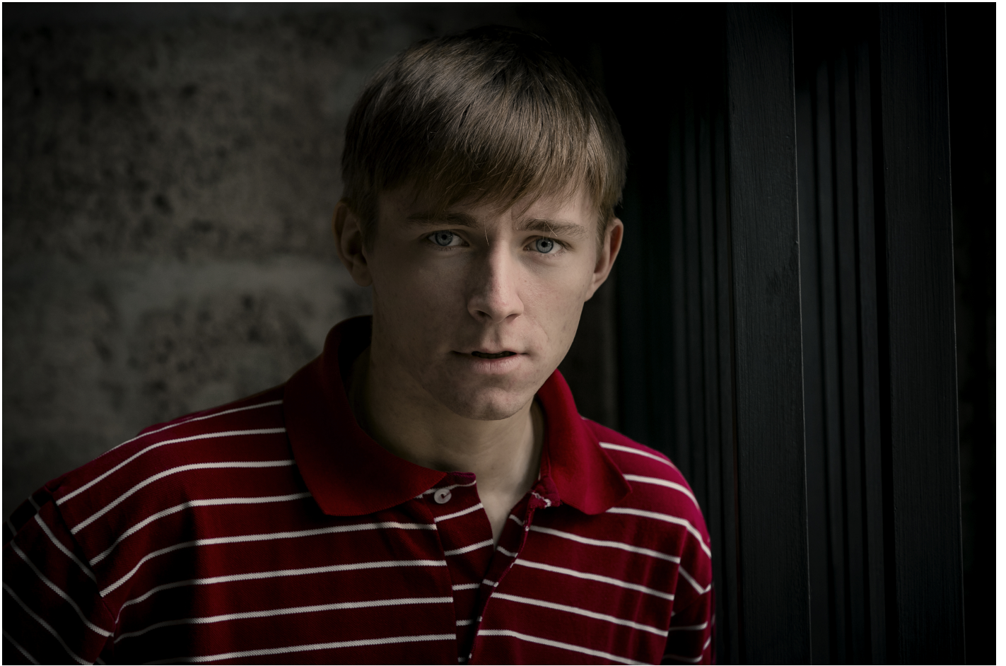
Cornelius Kiene - Foto 3