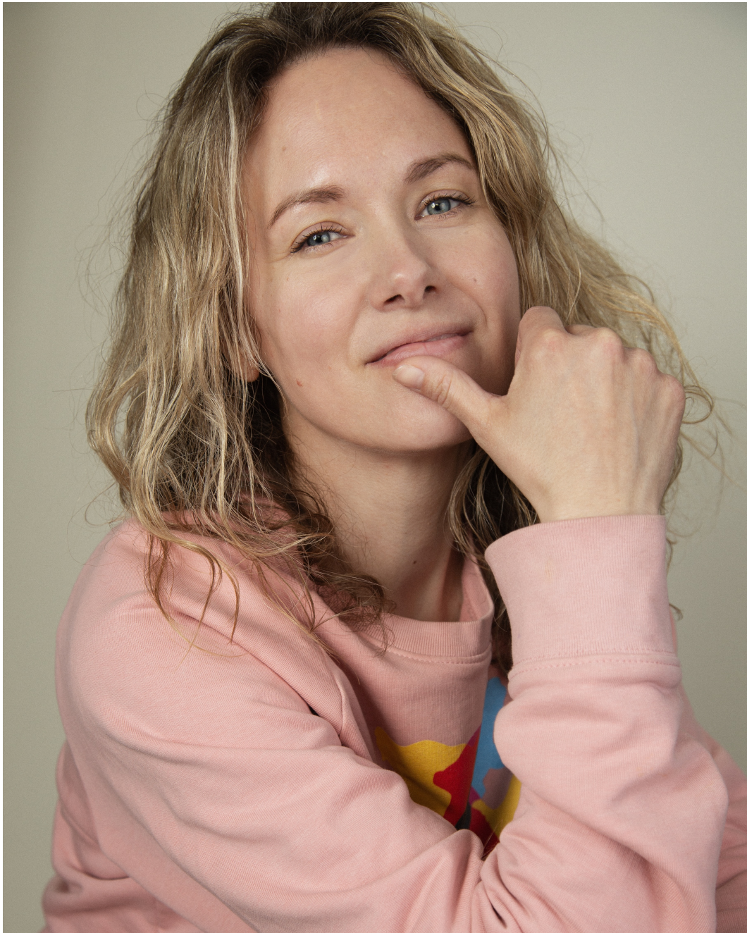
Mette Lysdahl - Foto 7